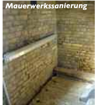
Die Südwestecke der oberen Glockenstube.

denn eine große Mauerwerkssanierung der Kirche steht an • Der KGR hat Architekt Jens Lassen beauftragt, die Arbeiten zu planen